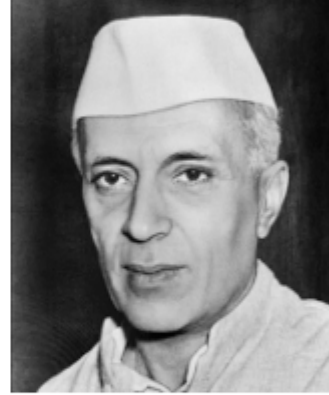
ஜவகர்லால் நேரு (முதல் பிரதம அமைச்சர்)

தலைவர் நியமிக்கிறார். மக்களவையில் எந்த ஒரு கட்சிக்கும் தனிப்பெரும்பான்மை பலம் இல்லையெனில் குடியரசுத் தலைவர் எந்தக்கட்சி அமைச்சரவையை அமைக்க முடியுமோ அக்கட்சியின் தலைவரை அவர் அழைத்து அரசு அமைக்கக் கூறலாம். குடியரசுத் தலைவர் அமைச்சர்களுக்குப் பதவிப் பிரமாணமும், இரகசியக்காப்புப் பிரமாணமும் செய்து வைக்கின்றார். நாடாளுமன்ற உறுப்பினராக இல்லாதவர் கூட அமைச்சராக நியமிக்கப்படலாம். ஆனால் அவர் 6 மாதங்களுக்குள் ந ா ட ா ளு ம ன் ற த் தி ற் கு த் தேர்ந்தெடுக்கப்படுதல் வேண்டும். அமைச்சர்கள் தனிப்பட்ட முறையிலும், ஒட்டு மொத்தமாகவும் மக்களவைக்கு பொறுப்புடையவர்களாவர்.