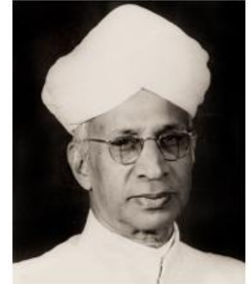
DR. RADHA KRISHNAN (First Vice President of India)

63 of the constitution provides for a Vice President of India. This office has been created to maintain the political continuity of the state.