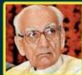
Krishan Kant (1997-2002)