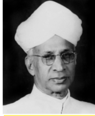
டாக்டர். ராதாகிருஷ்ணன் (முதல் துணைக் குடியரசுத் தலைவர்)

அரசியலமைப்பின் 63வது சட்டப்பிரிவு இந்திய துணைக் குடியரசுத் தலைவர் பதவியை வழங்குகிறது. நாட்டின் இரண்டாவது உயர்ந்த பதவியைத் துணைக் குடியரசுத் தலைவர் வகிக்கிறார். அலுவலக முன்னுரிமையின் படி குடியரசுத் தலைவருக்கு அடுத்த தர நிலையில் இவர் உள்ளார். இப்பதவி அமெரிக்க துணைக் குடியரசுத் தலைவரின் பதவியைப் போன்றது. நாட்டின் அரசாங்க நடவடிக்கைகள் தொடர்ச்சியாக நடைபெற இப்பதவி உருவாக்கப்பட்டுள்ளது.